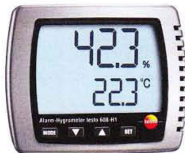
Рис. 1. Прибор комбинированный Testo 608-H1

Внешний вид приборов комбинированных показан на рисунках 1-5