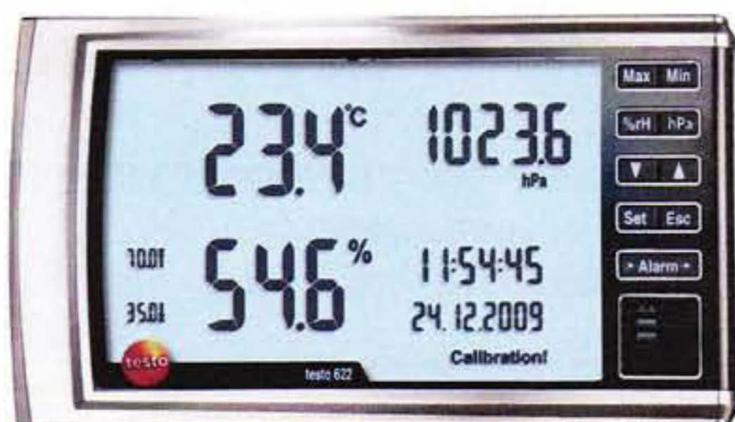
Рис. 4. Прибор Комбинированный Testo 622