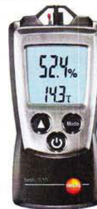
Рис. 3. Прибор комбинированный Testo 610