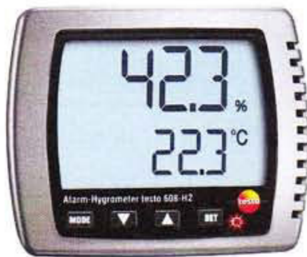
Рис. 2. Прибор комбинированный Testo 608-H2