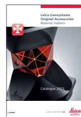
Оригинальные аксессуары Leica Geosystems