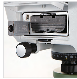
УДОБНЫЙ ОБМЕН ДАННЫМИ