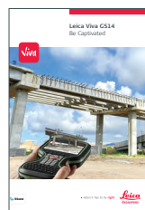
Leica Viva GS14