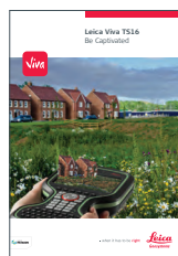
Leica Viva TS16

Иллюстрации, описания и технические характеристики могут быть изменены в одностороннем порядке. Все права защищены. Правообладатель Leica Geosystems AG, Хербрюгг, Швейцария, 2015. 841871en – 10.15 – INT