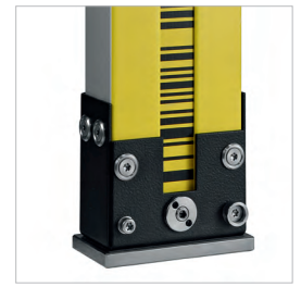
ИСПОЛЬЗОВАНИЕ КОДОВЫХ ИНВАРНЫХ РЕЕК