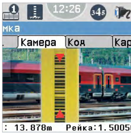
НАВЕДЕНИЕ С ПОМОЩЬЮ ЦИФРОВОЙ КАМЕРЫ