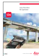
Leica Viva GS14