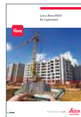
Leica Nova MS60