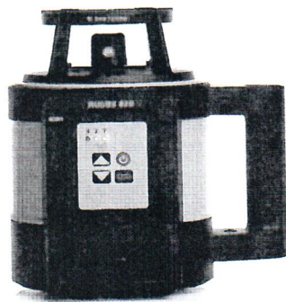
Leica Rugby 820